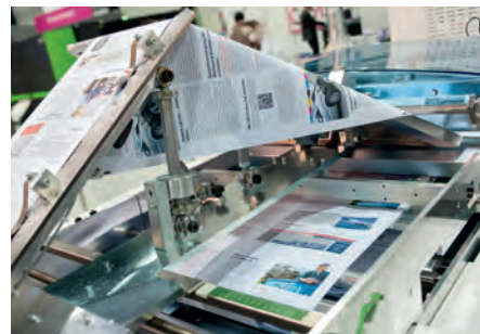
Het vouwen van de papierbaan.

Ook Xeikon en HP waren opnieuw in Luzern present. Xeikon vormt er nog altijd een buitenbeentje door nadrukkelijk niet voor inkjet te kiezen. Ze toonde haar tonergebaseerde Xeikon 8600 - voor de tijdens Drupa aangekondigde Trillium liquid toner -technologie is het nog te vroeg - waarop beveiligd drukwerk werd geproduceerd met echtheidskenmerken