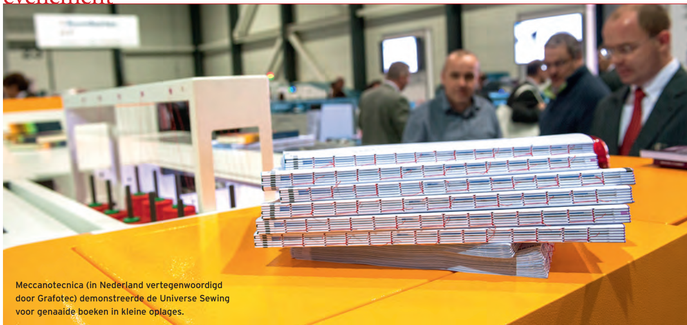
Meccanotecnica (in Nederland vertegenwoordigd door Grafotec) demonstreerde de Universe Sewing voor genaaide boeken in kleine oplages.