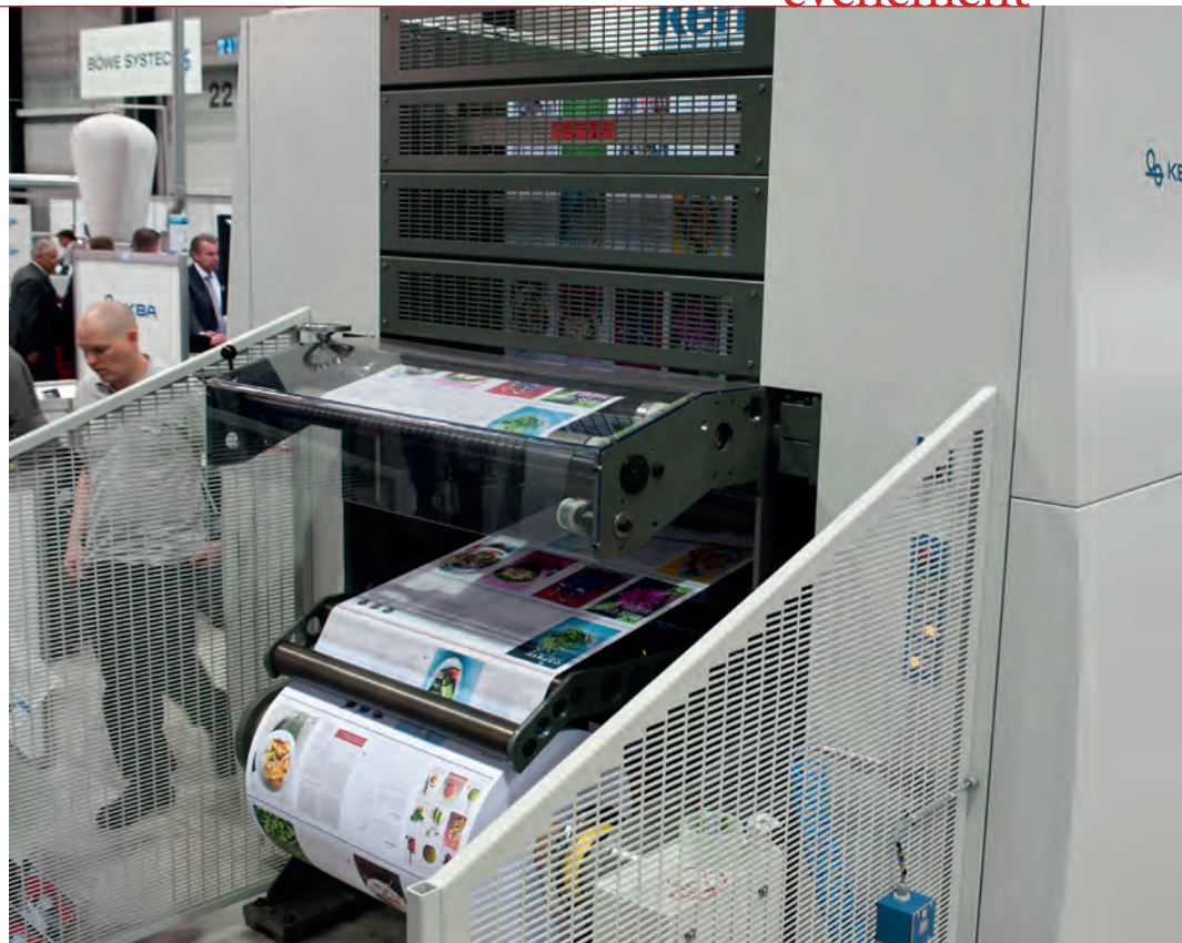
KBA presenteerde de verbeterde versie van de RotaJet 76 in Luzern.

Hunkeler heeft natuurlijk ook wel ideeën over waar het straks naar toe gaat. Dat mag bijvoorbeeld worden afgeleid uit de nieuwe POPP8-apparatuur, die tijdens de Innovationdays een wereldpremière beleefde. De unwinder (de module aan de voorkant van de printer die de papierbaan afrolt) en de rewinder (voor het weer oprollen van de bedrukte papierbaan) in deze serie komen pas eind dit jaar op de markt, maar de specificaties maken duidelijk in welke richting we mogen denken: