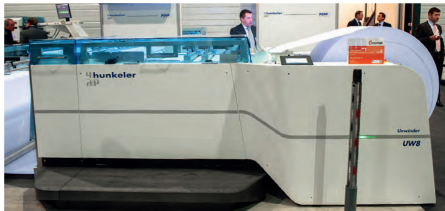
De nieuwe Hunkeler POPP8 Unwinder haalt een topsnelheid van 305 meter per minuut.

ners uit om de eigen apparatuur te komen demonstreren in combinatie met een of meerdere Hunkeler-modules. Daarmee biedt dit evenement een unieke gelegenheid om de stand van zaken in kaart te brengen, want bijna alle grote namen uit de printwereld zijn er bij. Canon, Impika, Kodak, Ricoh, Screen en Xerox toonden er hun inkjetsystemen. Xerox onthulde een nieuwe versie van de CiPress - het inkjetsysteem dat de Amerikanen hier twee jaar geleden voor het eerst toonden en waarvan, naar eigen zeggen, nu in vijf Europese landen een of meer exemplaren zijn geïnstalleerd. De nieuwe CiPress SED is een