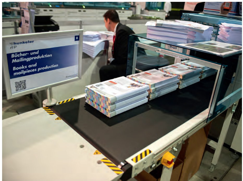
Belangrijke markten voor rotatief printen: boeken en direct mail.

En een Cloud Print 2013 -presentatie, waar het Nederlandse Peecho met haar internet printbutton veel interesse wakte. Maar de meeste aandacht ging toch uit naar het Digital Book Printing Forum . Onderzoek door Interquest bevestigde daar nog eens de bekende trends in de krimpende boeken-industrie, maar concludeerde bovendien dat op dit moment nog maar vijf procent van alle boeken digitaal wordt geprint: 'Daar liggen dus toch nog enorme kansen.' Dat hadden